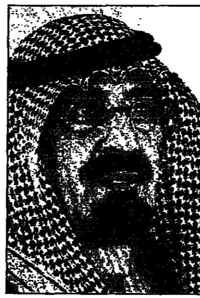
الأمير عبد الله